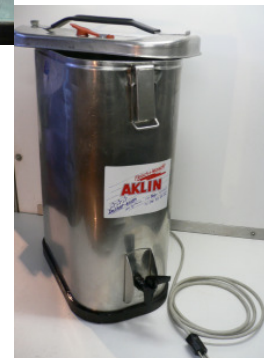
Tee-/Kafibehälter mit Ausgusschahnen 18 lt 220 V, nur 100W Heiz