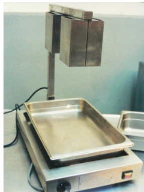
Warmplatte mit Lampe