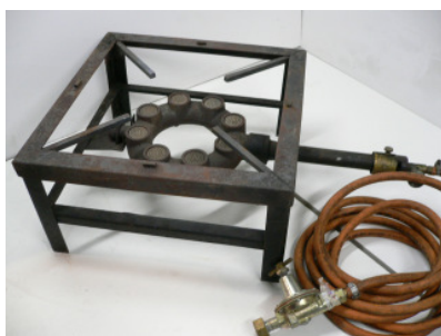
Gasstark-Brenner 30 KW