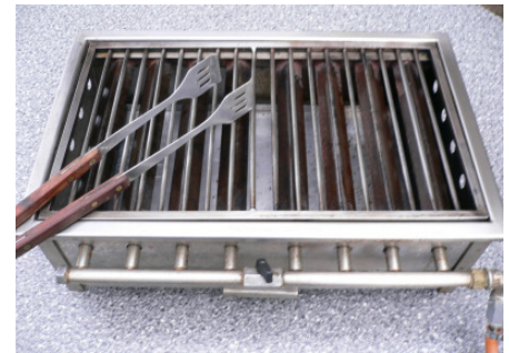
Gasgrill klein 50 x 30 cm (Grillgitter)