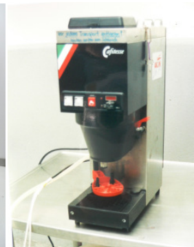
Cafitesse Automat mit Schümli- Kafi, 220V 2 KW, Ansaugpumpe