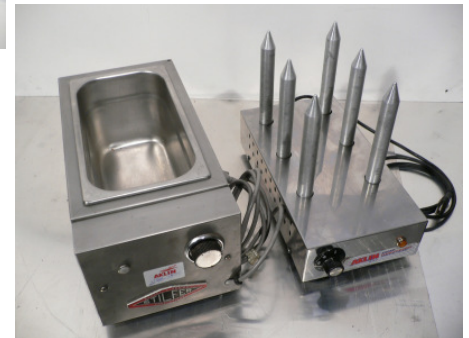
kleines Wasserbad für Würstli und 6er Spiess Hot-Dog-Apparat