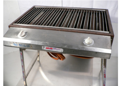
Selzam Gasgrill 50 x 80 cm (Gitter)