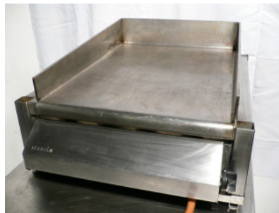
Hamburger-Gasgrill mit Platte