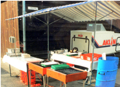
nach Hygienevorschrift überdachter Grillstand im Freien.