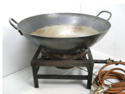
WOK-Pfanne 70 cm