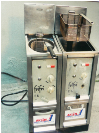
Monofriteusen, 6-10 KW