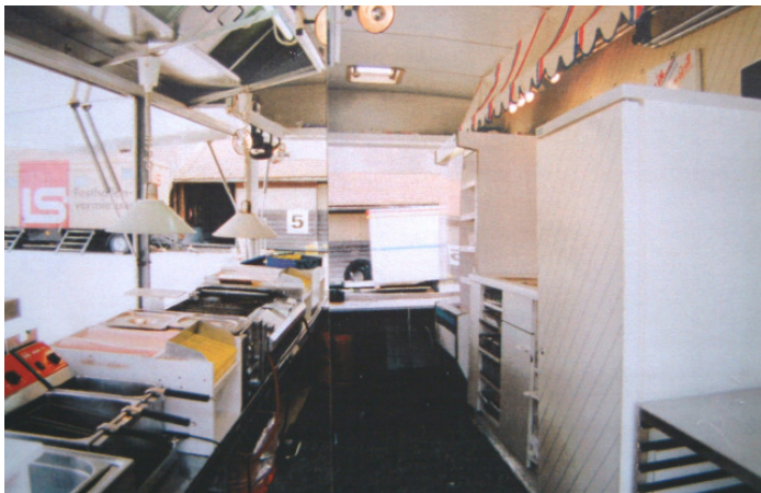
rationelle, profimässige, robuste Kücheneinrichtung

3 Stehtischli, 3 Kehrtsackständer sind im Wageninventar.